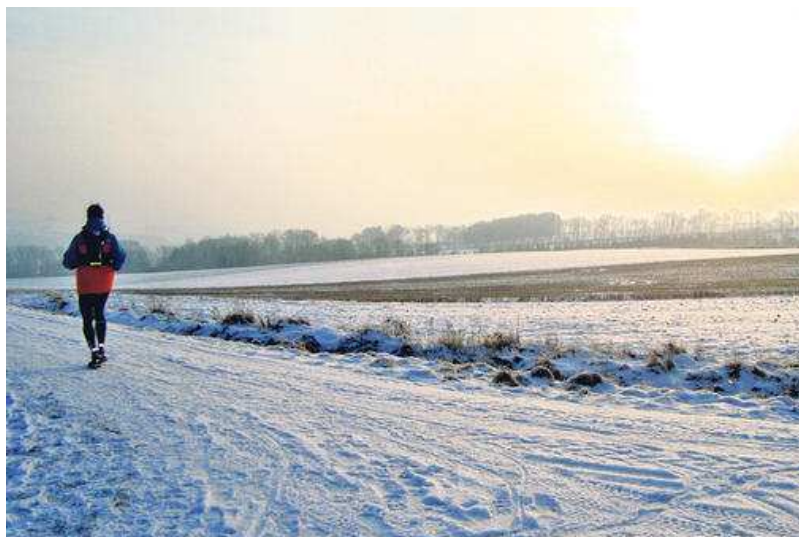
Unterwegs in schneebedeckter Landschaft: Läufer auf dem Weg zum Brocken.

Trotz sehr kalter Temperaturen haben bei der Brocken-Challenge 2012 130 von 143 Startern den Weg ins Ziel gefunden. Der vom Verein Ausdauersport für Menschlichkeit (ASFM) veranstaltete Wohltätigkeits-Ultramarathon war in Göttingen gestartet worden und endete auf dem Brocken, dem höchsten Punkt des Harzes.